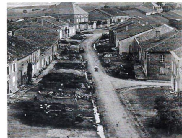
Exposition de tas de fumier devant les maisons d'un bourg en Lorraine.

Article 1 er : Il est défendu de jeter des eaux quelconques par les fenêtres, de rien jeter dans les rues qui puisse infecter l'air non plus que des verres cassés et autres objets qui pourraient blesser les hommes et les animaux ;