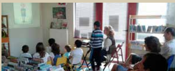
Conte numérique – été 2016