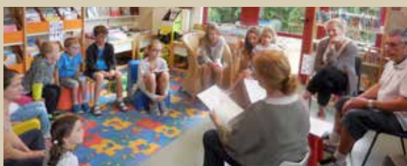
Racontines contes détournés - juillet 2017

Rendez-vous mensuel le samedi matin à 11h15 : histoires thématiques lues à voix haute par l'équipe de la médiathèque pour les enfants à partir de 4 ans.