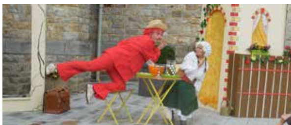
Gabilolo et Mademoiselle Réséda pour le plaisir des plus petits et des plus grands

Vendredi 25 août, le public est venu nombreux assister aux représentations proposées par la compagnie Azor dans le cadre du Festival Théâtre au Village.