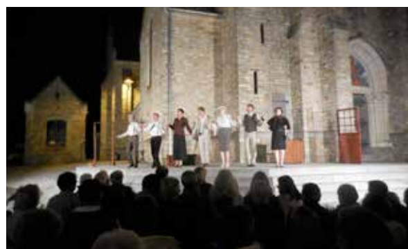
Tous les comédiens de « Topaze » sous les applaudissements du public

L'interprétation de « Topaze » de Marcel Pagnol a captivé les spectateurs : un texte d'auteur qui reste d'actualité avec la dénonciation de la corruption et du pouvoir de l'argent, le tout avec beaucoup d'humour. Les comédiens ont montré tout leur professionnalisme avec des personnages hauts en couleur, transformant le parvis de l'église en scène de théâtre : les répliques fusaient ainsi que les applaudissements. Une bonne occasion pour partager un moment convivial entre amis autour d'un verre et des fameuses galettes-saucisses.