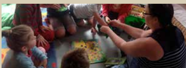
Atelier contes détournés - juillet 2017