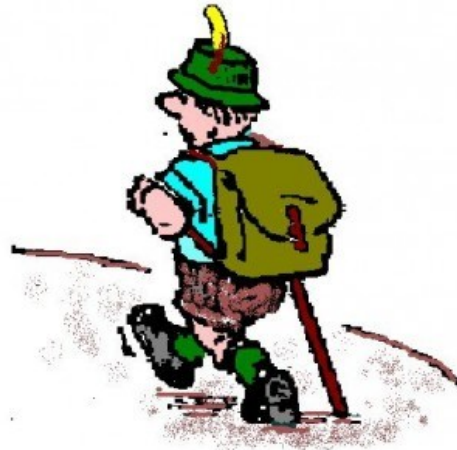
Halte devant le château de la Giraudais