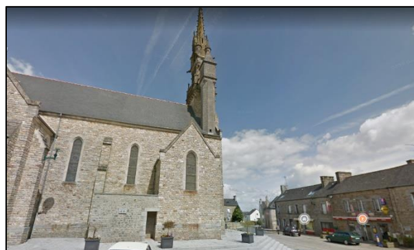
Place de l'église - commerces