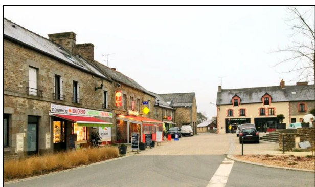
Place de l'église - commerces