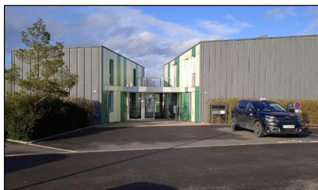
Maison des services intégrant la maison médicale